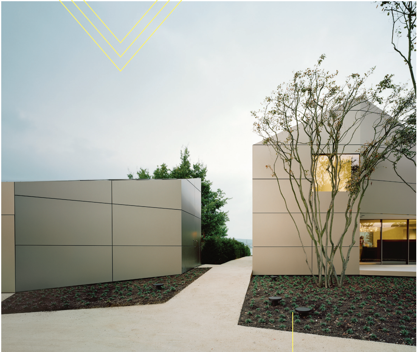
Villa at Lake of Constance, Germany Biehler Weith Associated ALUCOBOND® PLUS anodized look C32